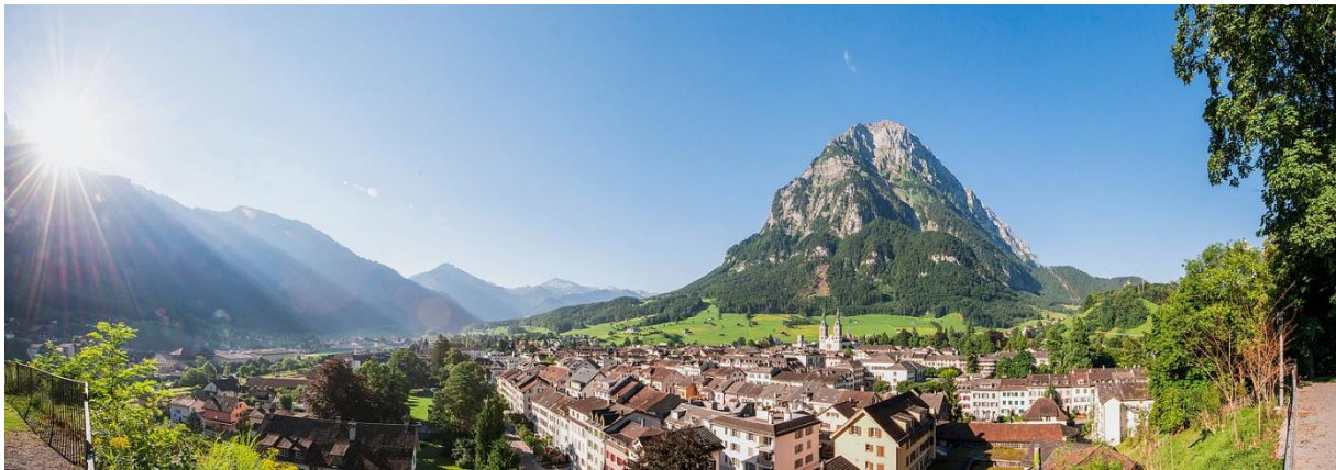
Die Stadt Glarus mit dem Glärnisch im Hintergrund, Samuel Trümpy

Das Glarnerland ist eine malerische Region in den Schweizer Alpen, bekannt für ihre imposante Bergwelt, idyllischen Dörfer und reiche Geschichte. Die Region bietet eine perfekte Mischung aus Natur, Kultur und Tradition. Glarus selbst bezeichnet sich als «kleinste Kantonshauptstadt der Schweiz» und beeindruckt durch die charmante Altstadt mit ihren historischen Gebäuden und die Nähe zu atemberaubenden Wander- und Ausflugsmöglichkeiten.